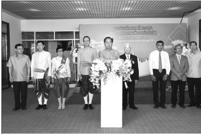
สถาปนาฝนหลวง : นายกฤษฏา บุญราช รัฐมนตรีว่าการกระทรวงเกษตรและสหกรณ์ เป็นประธานงานวันคล้ายวันสถาปนากรมฝนหลวงและการบินเกษตร ครบรอบ ปีที่ 6 พร้อมเป็นประธานเปิดพิพิธภัณฑ์และห้องสมุดกรมฝนหลวงและการบินเกษตร ณ กรมฝนหลวงและการบินเกษตร เมื่อเร็วๆ นี้